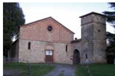
L'ingresso della nostra (ormai assai prossima) sede a Badia di Monte San Pietro (Bo).

Verrà data sempre risposta a tutti gli ordini, anche se riguardanti titoli già venduti. Trascorsi 30 gg. senza aver ricevuto quanto ordinato Vi preghiamo di voler considerare ciò come un disguido e di contattarci nuovamente.